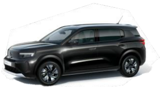
Negro Perla Nera

NOTA: Las descripciones, características y equipamientos son dados exclusivamente a título indicativo y podrán ser modificados sin previo aviso por Opel Chile S.A. Los valores de consumo y emisiones se basan en lo constatado en el proceso de homologación desarrollado ante el Ministerio de Transportes y Telecomunicaciones, a través del Centro de Control y Certificación Vehicular (3CV). En todo caso, el rendimiento efectivamente obtenido por cada conductor dependerá de sus hábitos de conducción, de la frecuencia de mantenimiento del vehículo y de las condiciones ambientales y geográficas.