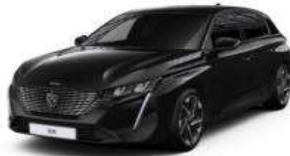
Perla Nera Black