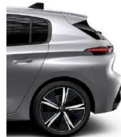
GT 18' Alloy Kamakura