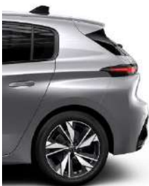
Allure MT6 17' Alloy Calgary