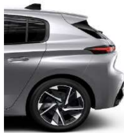
Allure EAT8 17' Alloy Halong