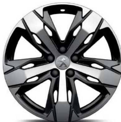
LOS ANGELES 18" Allure Pack/GTT