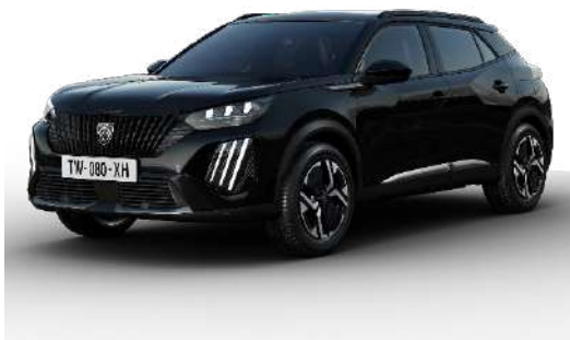
Perla Nera black