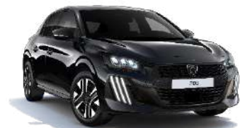
Negro Perla Nera