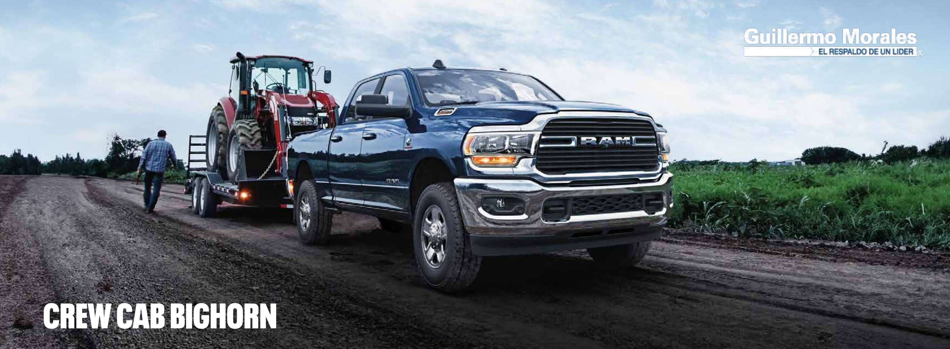
CREW CAB BIGHORN