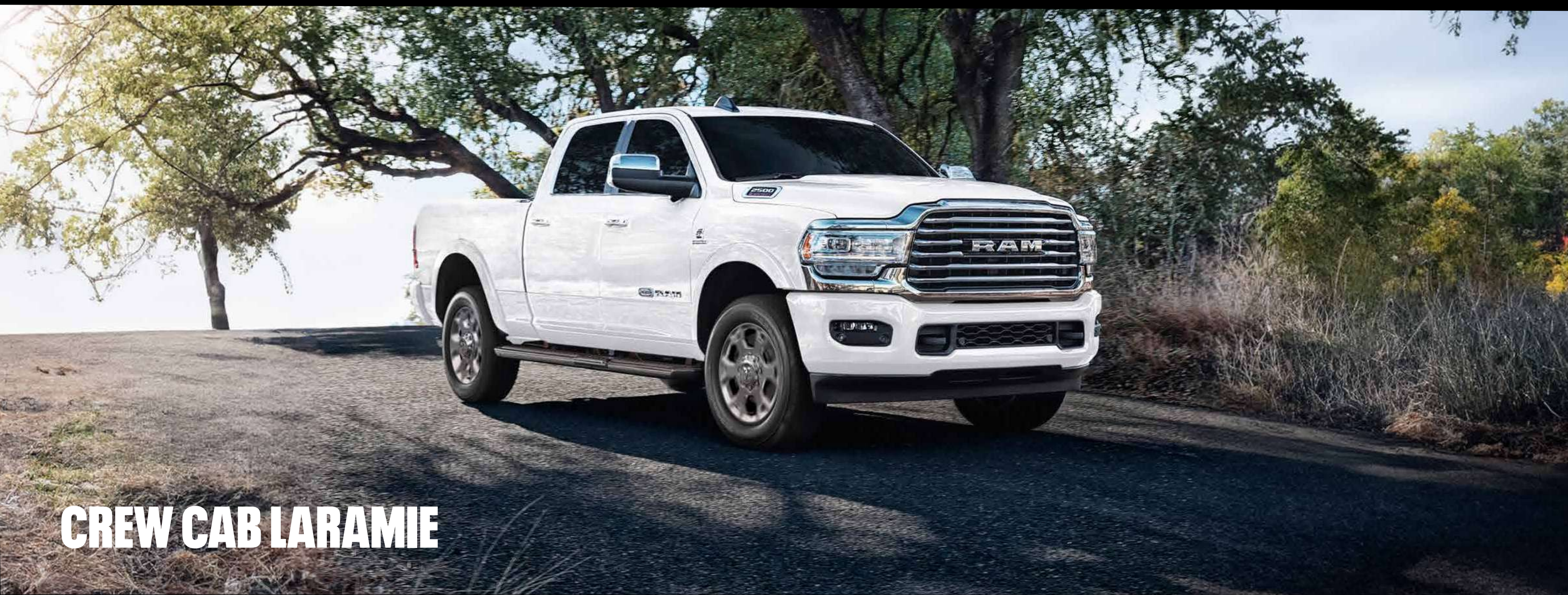
CREW CAB LARAMIE