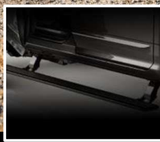
PISADERAS AUTOMÁTICAS DESPLEGABLES