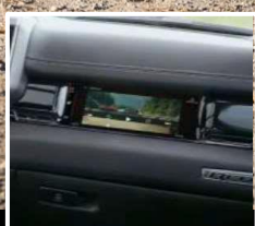
3ª PANTALLA INTERACTIVA PASAJERO