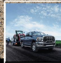
CAPACIDAD DE REMOLQUE 9 TON